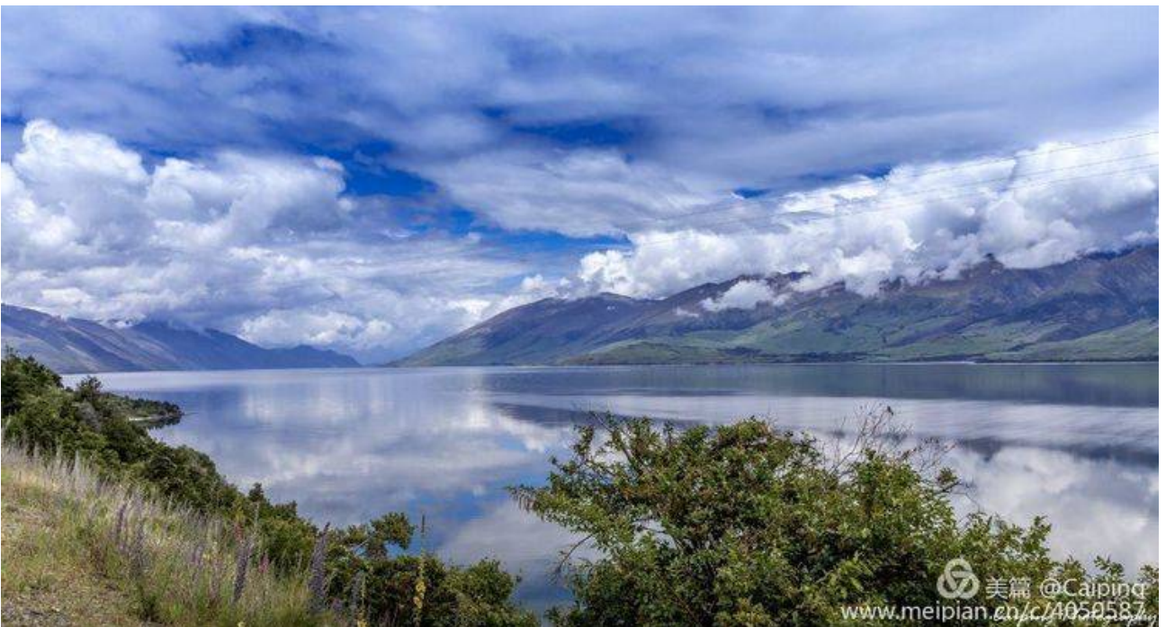
沿途湖光山色交相辉映，美不胜收。