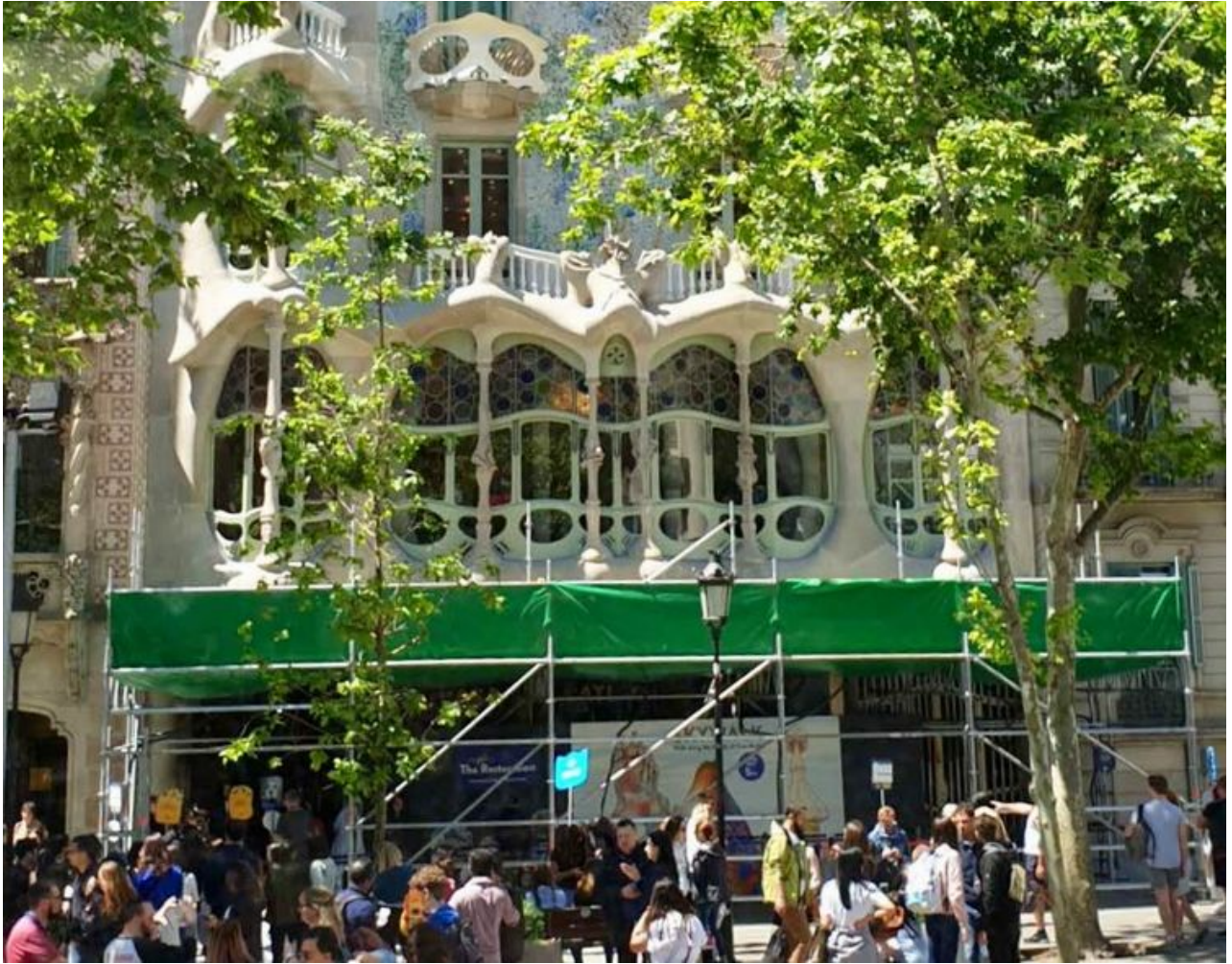
圣家族教堂，高迪倾尽他一生的最伟大的传世杰作