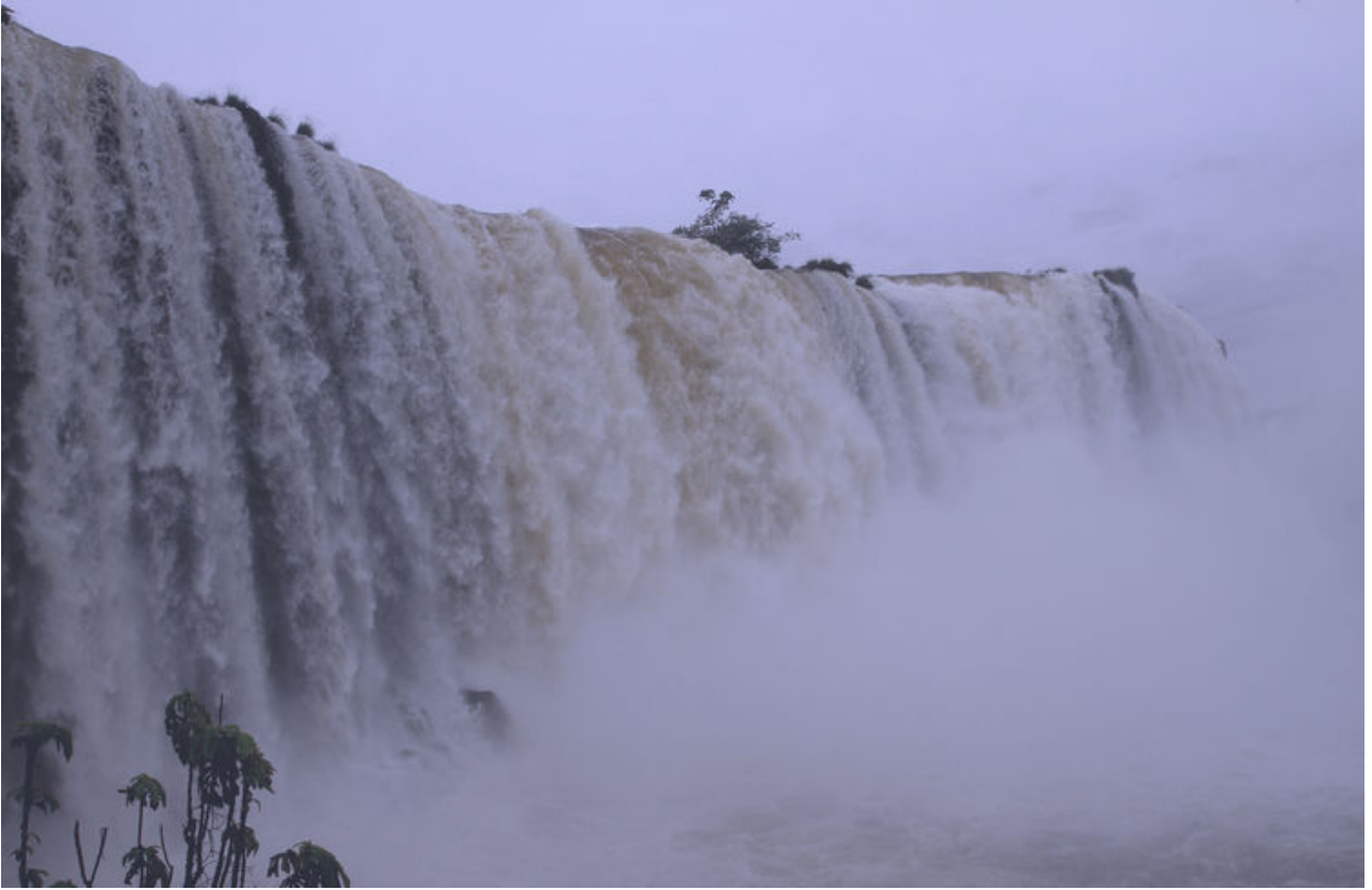
這裏是距離瞭望台最近的瀑布,響聲很大.