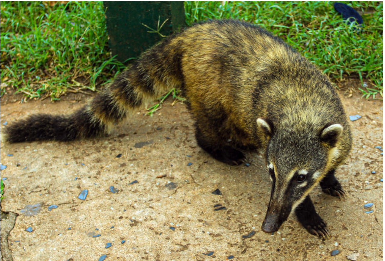
長鼻浣熊的長相有點像狐狸。