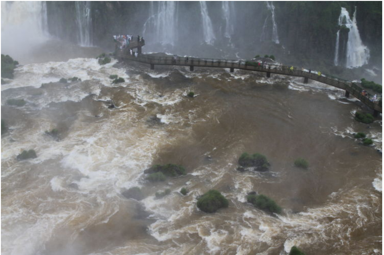
經過棧橋走到瀑布旁邊,要穿雨衣才行.