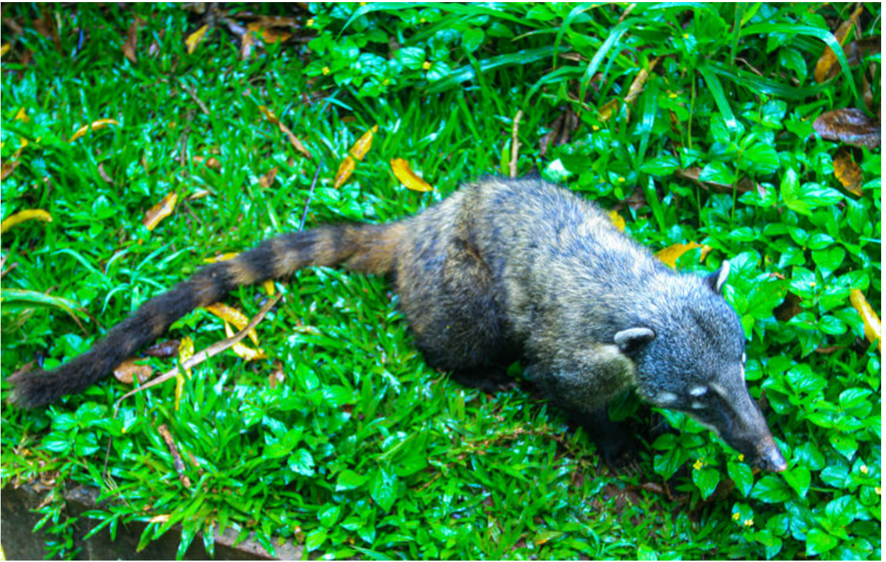
在路常見到這種"長鼻浣熊".