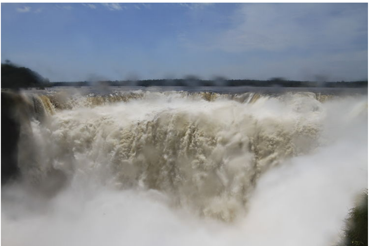
這就是主瀑布的壯觀場面.可以看出鏡頭上也都是水點.