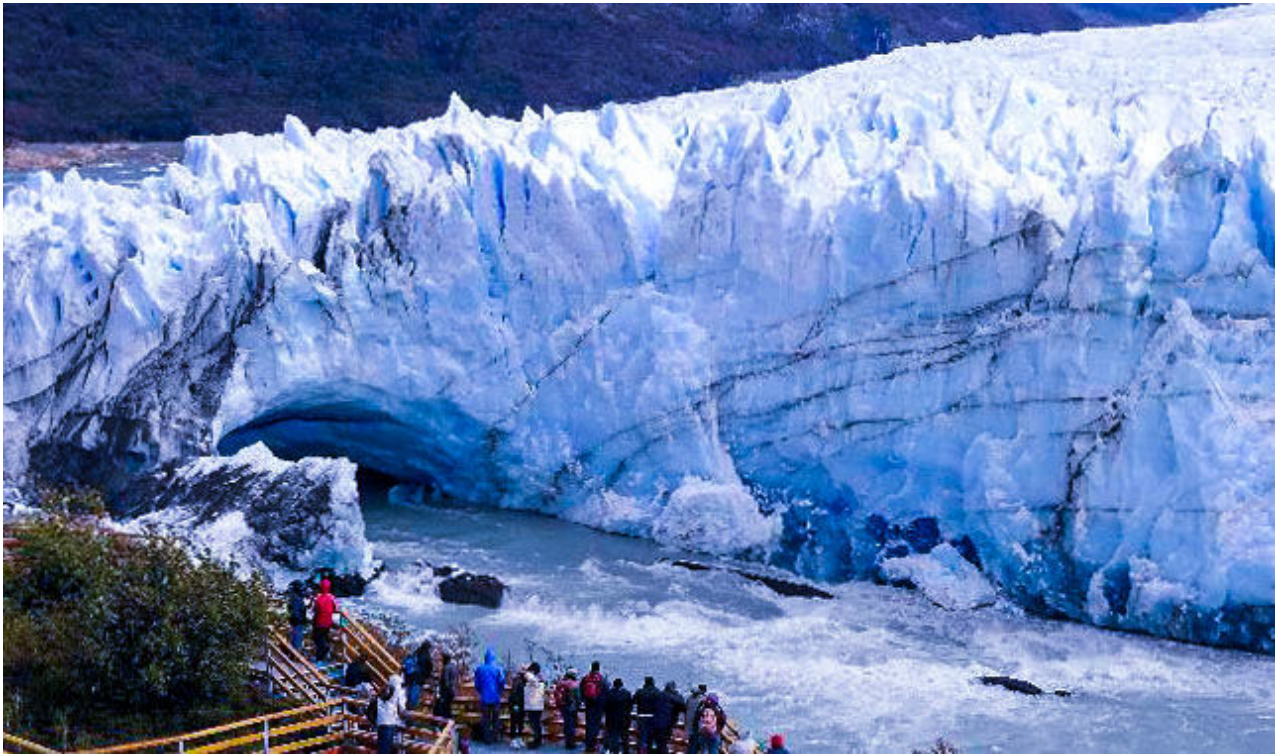
這裏更接近湖面,請留意"冰拱門".