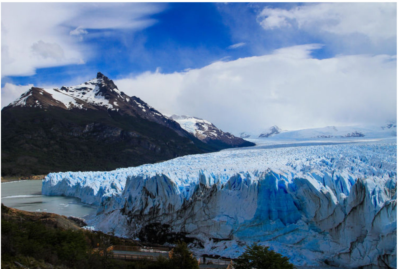
这是冰川的另一侧。