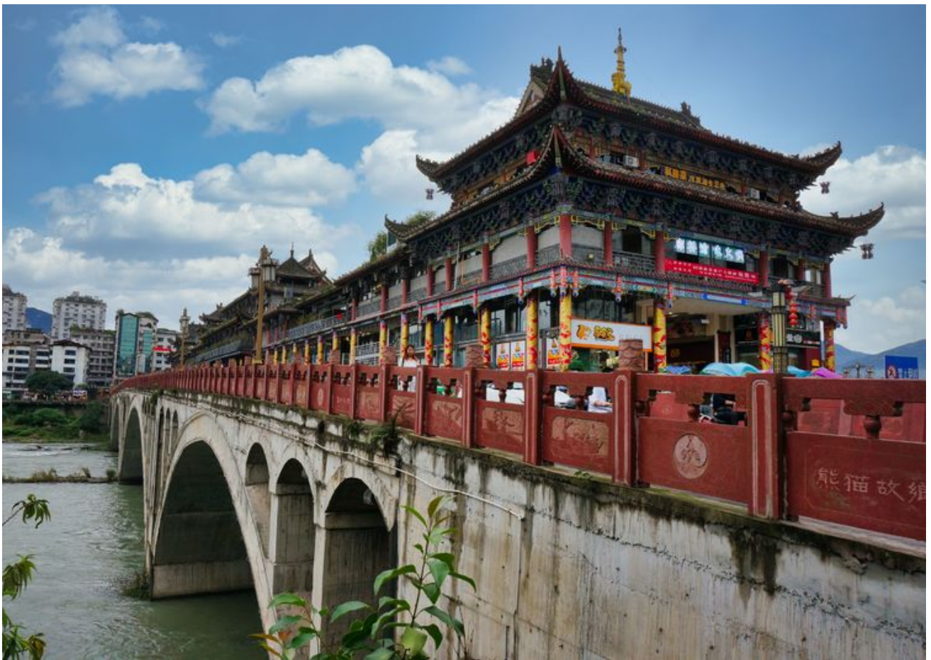
雅安廊桥。川西游应该说从这里开始。在桥上盖楼，很奇特的建筑。全长200多米，是世界上最长的廊桥。很美。