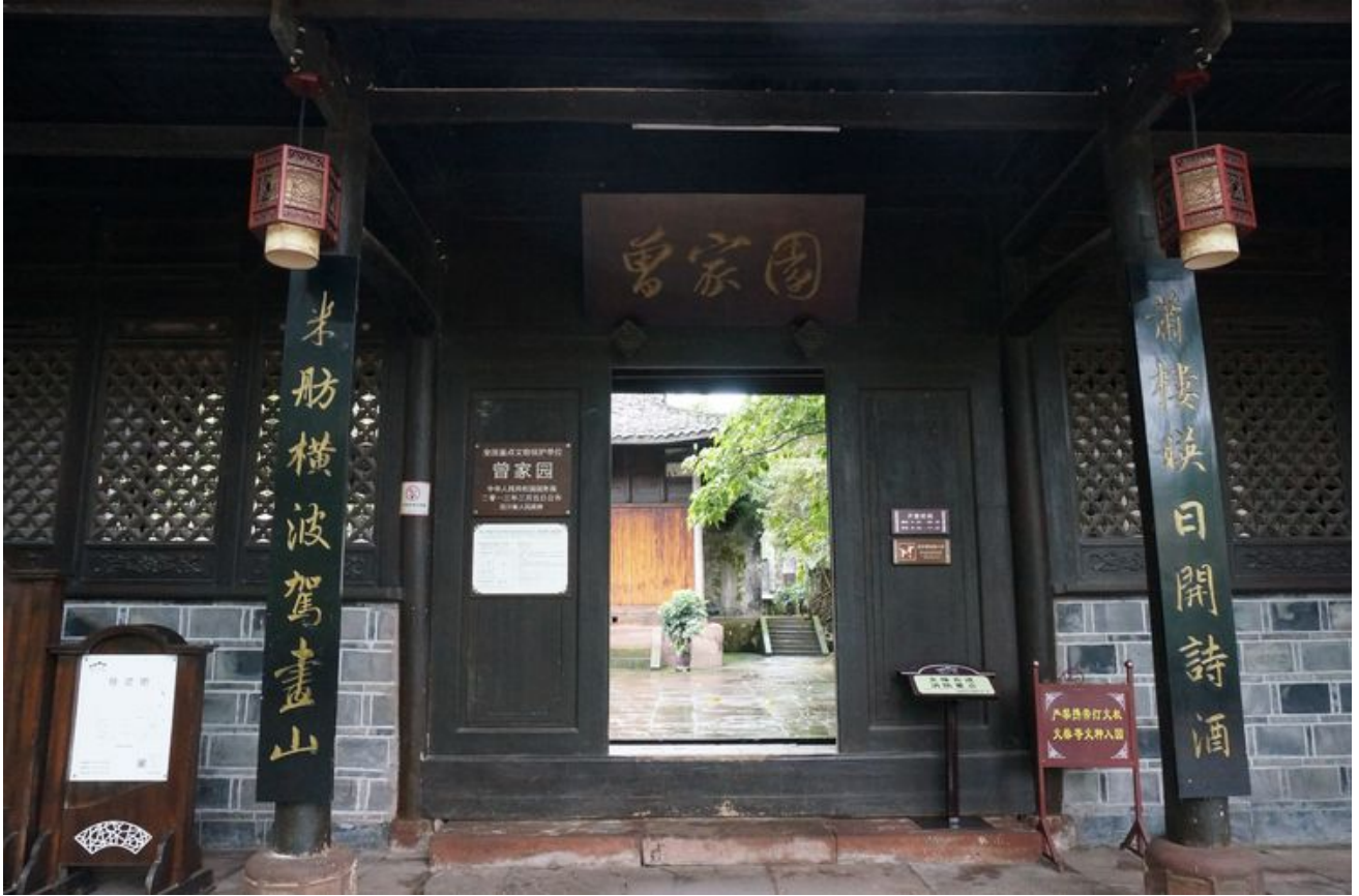
古镇中大户人家的住宅--曾家园保存良好，值得一看。