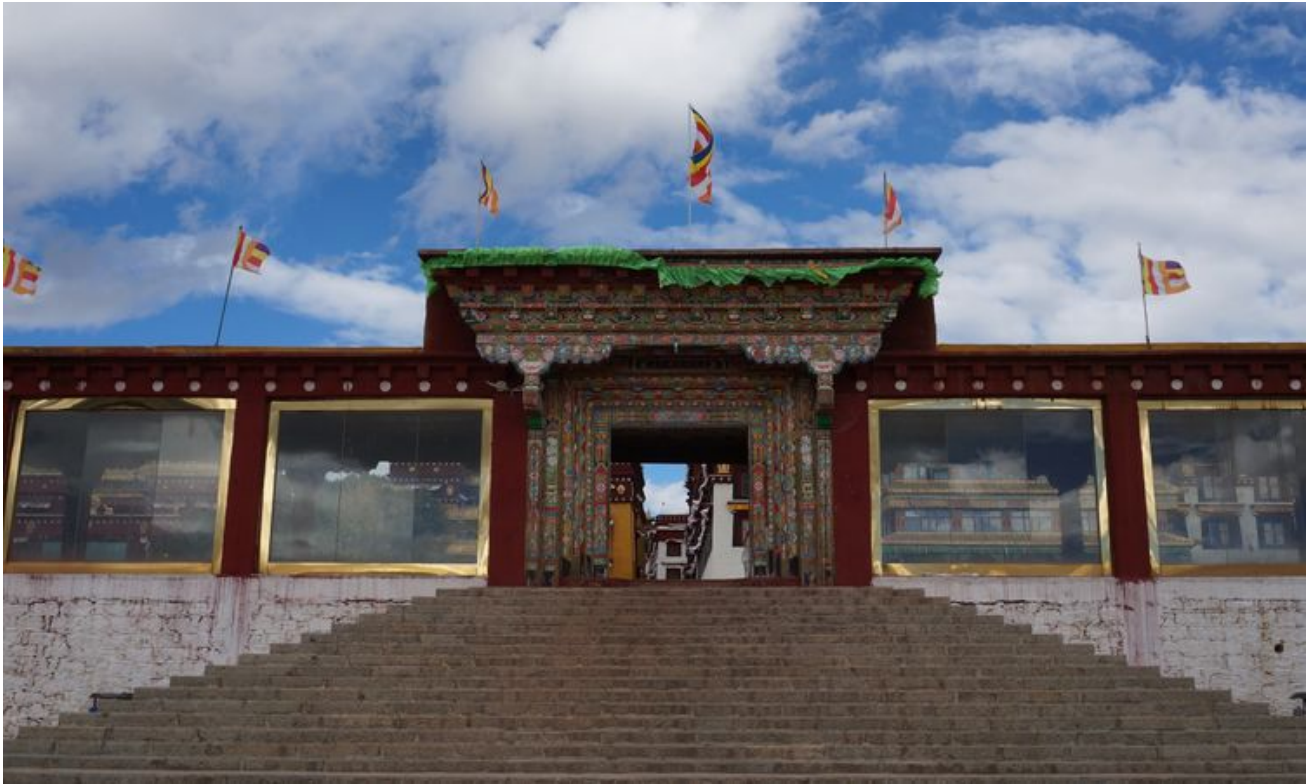
理塘的长青春科尔寺