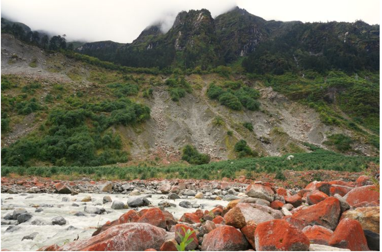
海螺沟到处是这种红石头。原以为含矿物质，实际上是微生物。