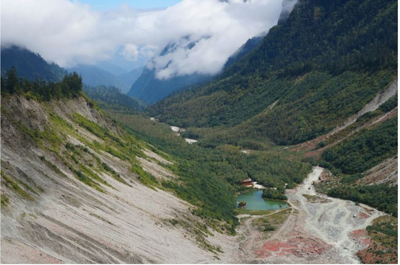
从缆车上拍摄的海螺沟