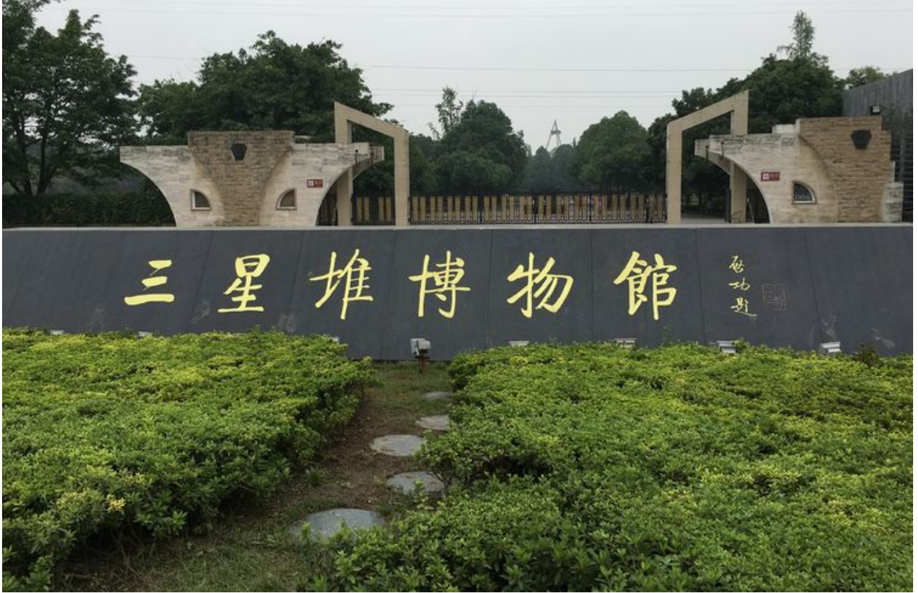
三星堆很值得参观