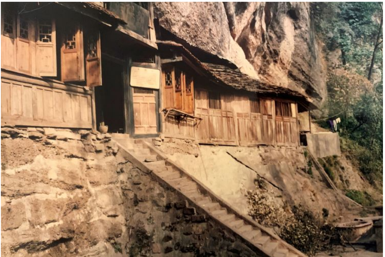
翻拍照片--青城山。早期的青城山很古朴。不知现在是否翻新并挂上红灯笼。青城山安静得没有一只鸟，很奇怪。是我没有见到？