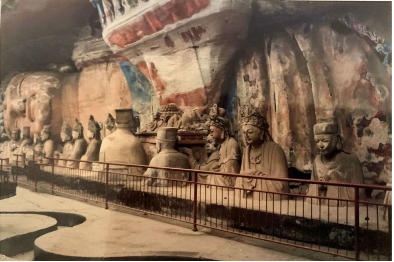
翻拍照片--大足石刻。这是在成都东南面，更靠近重庆。石刻是在一个悬崖下面，以卧佛为主体，展现释迦牟尼的生平和佛教故事。卧佛的脚并没有出现在石刻中，说是跟石刻还有一段距离。