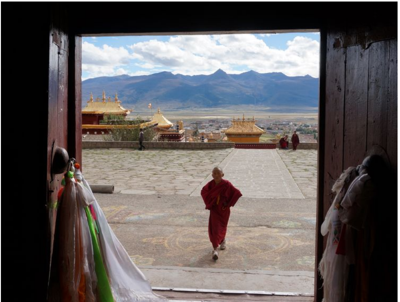
寺内有很多小喇嘛，下课的时候在院里踢毽子。