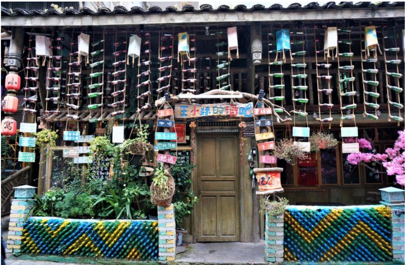
用酒瓶装饰的酒吧