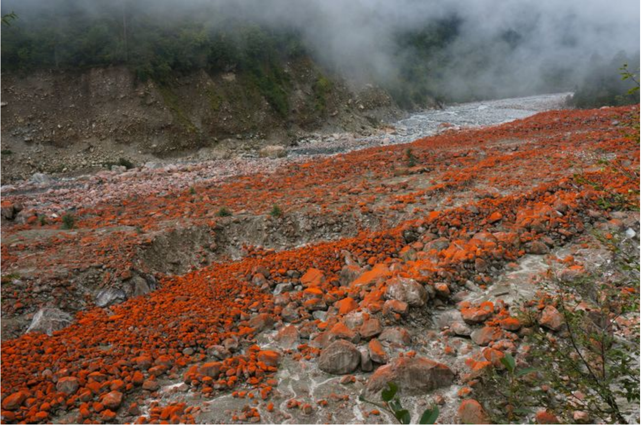
燕子沟，在海螺沟附近，也是布满红石头