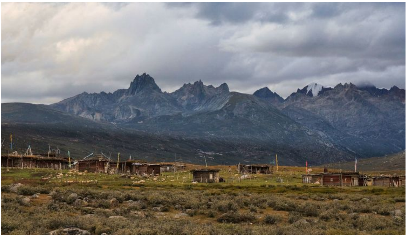
这些应该是牧民放牧时的临时住房