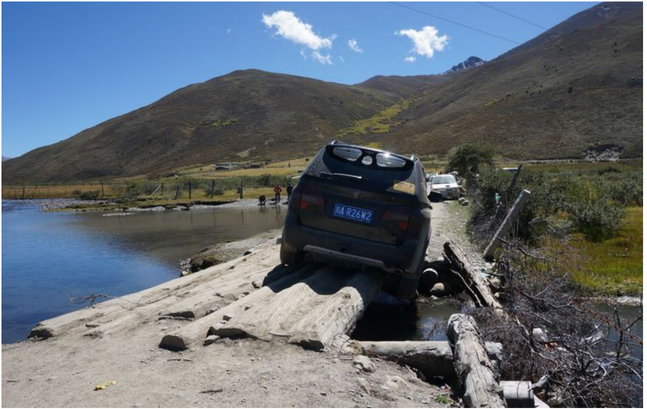
又一部越野车抛锚了，其他车无法过桥。