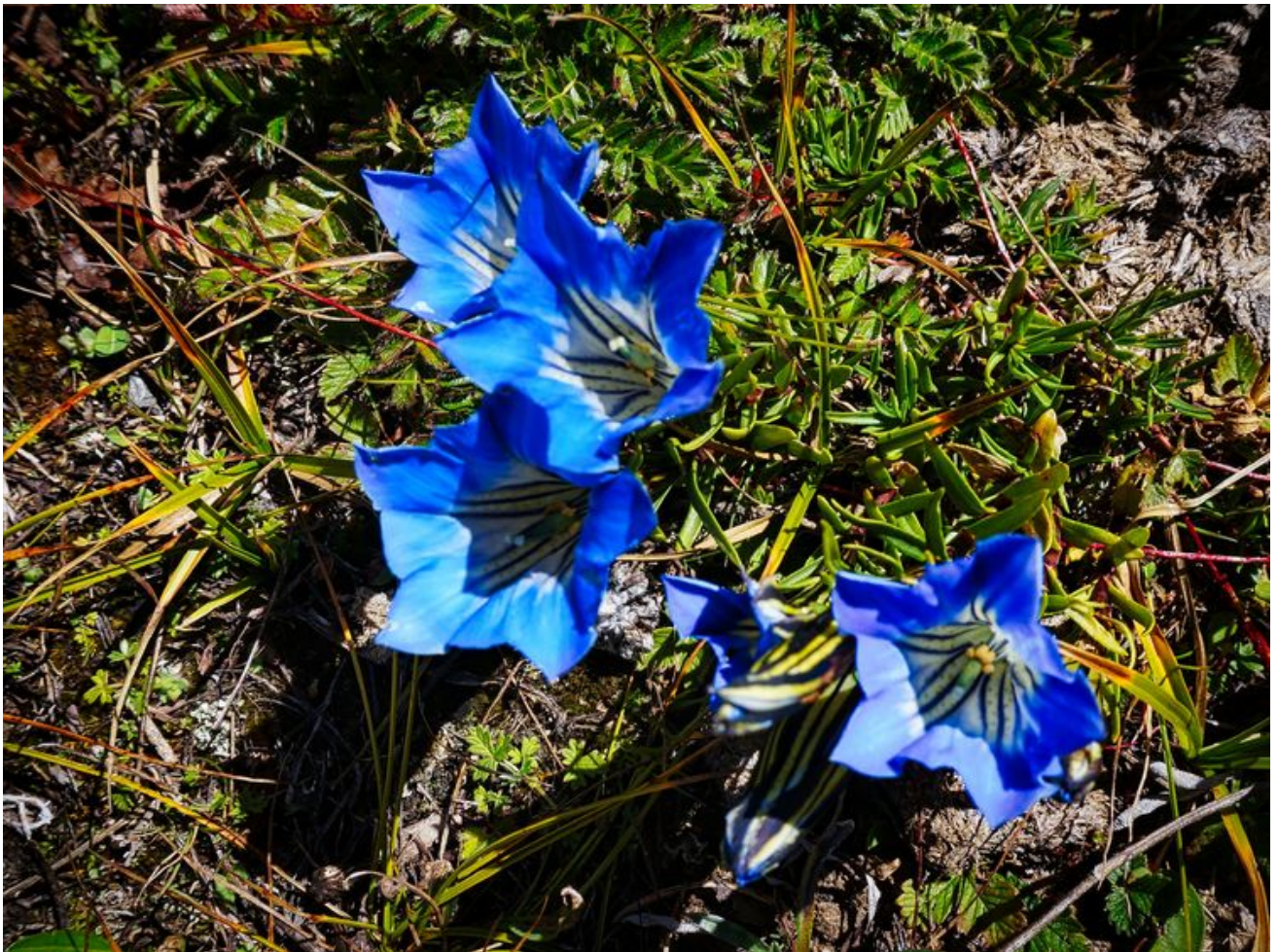
开在高山的蓝色龙胆花。当地人说，在六月份，山上开满鲜花，非常漂亮。