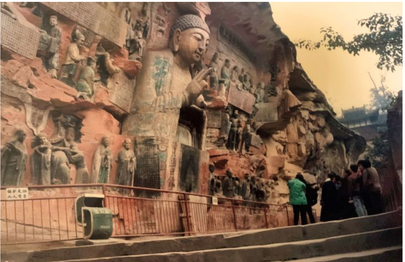
翻拍照片--大足石刻