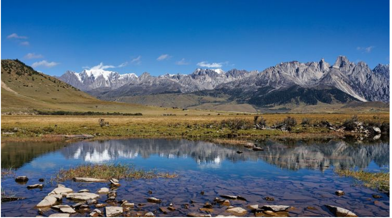
高山草甸，放牧的好地方。