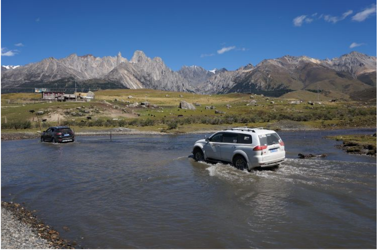
只好涉水而过，有点危险。第一部过了，后面才敢走。