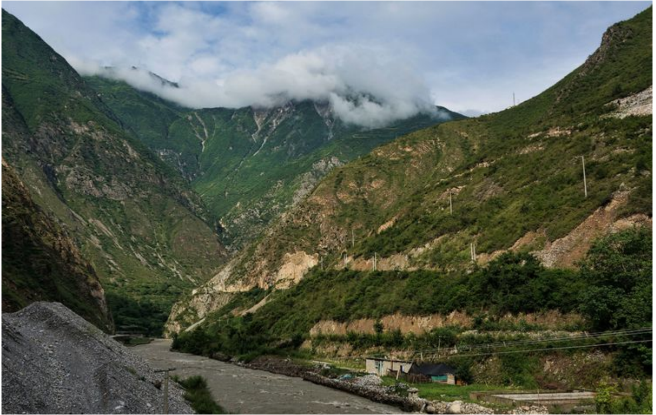
虽然修建或拓宽了道路，但还是不好走。