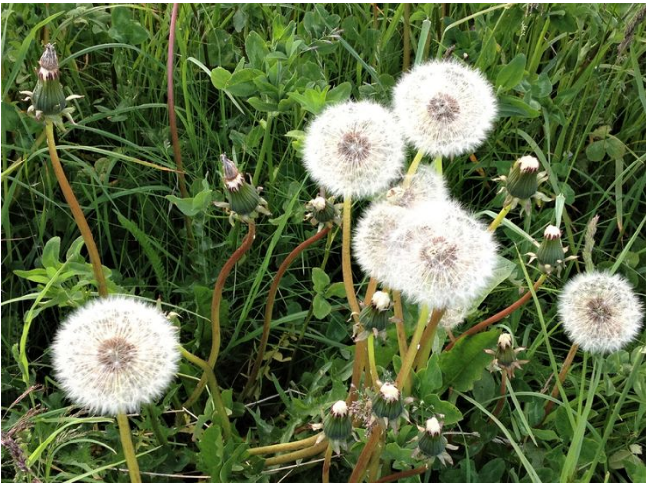
连蒲公英都特别大