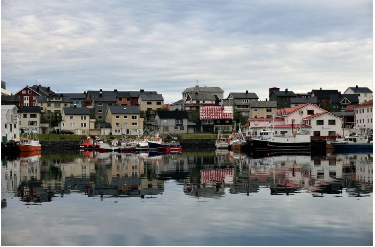
北角城镇，挺漂亮的。