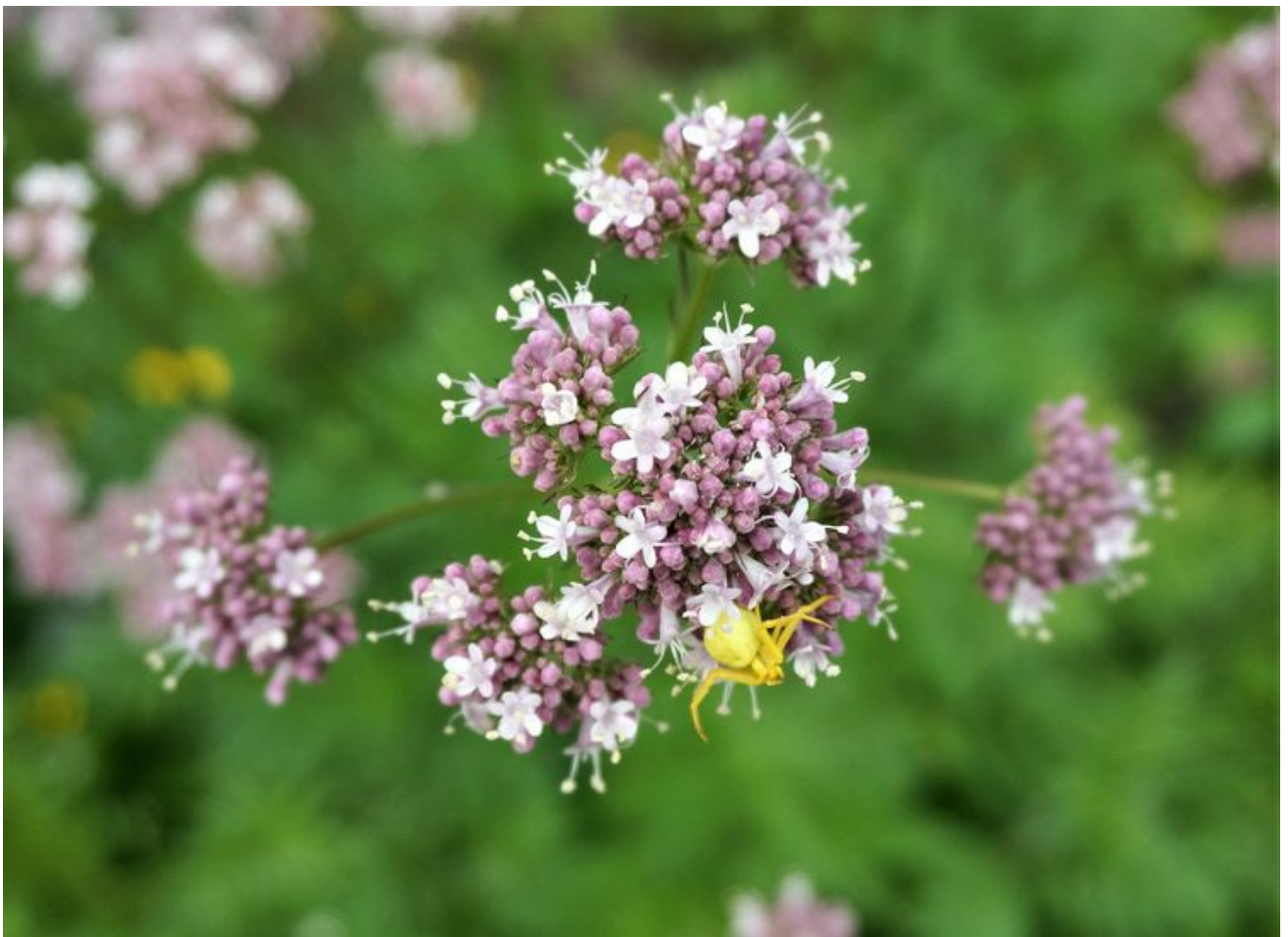
这黄色的好像是蜘蛛