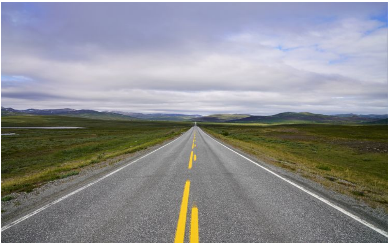
一马平川，但时速也只有80公里。