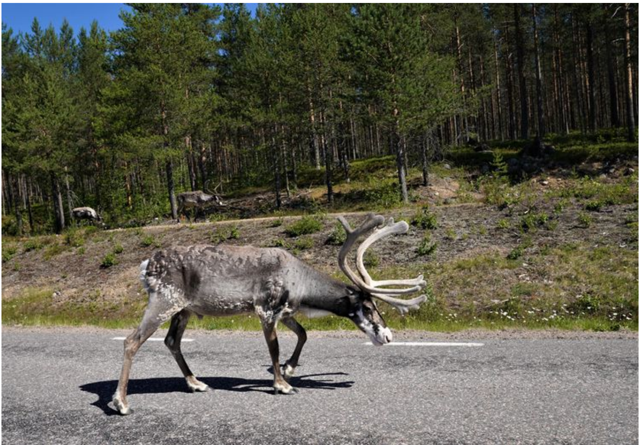
边界地区的野生驯鹿