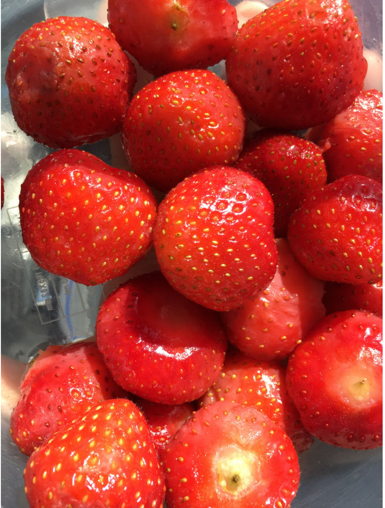
挪威的草莓，好甜好甜。第四美食。