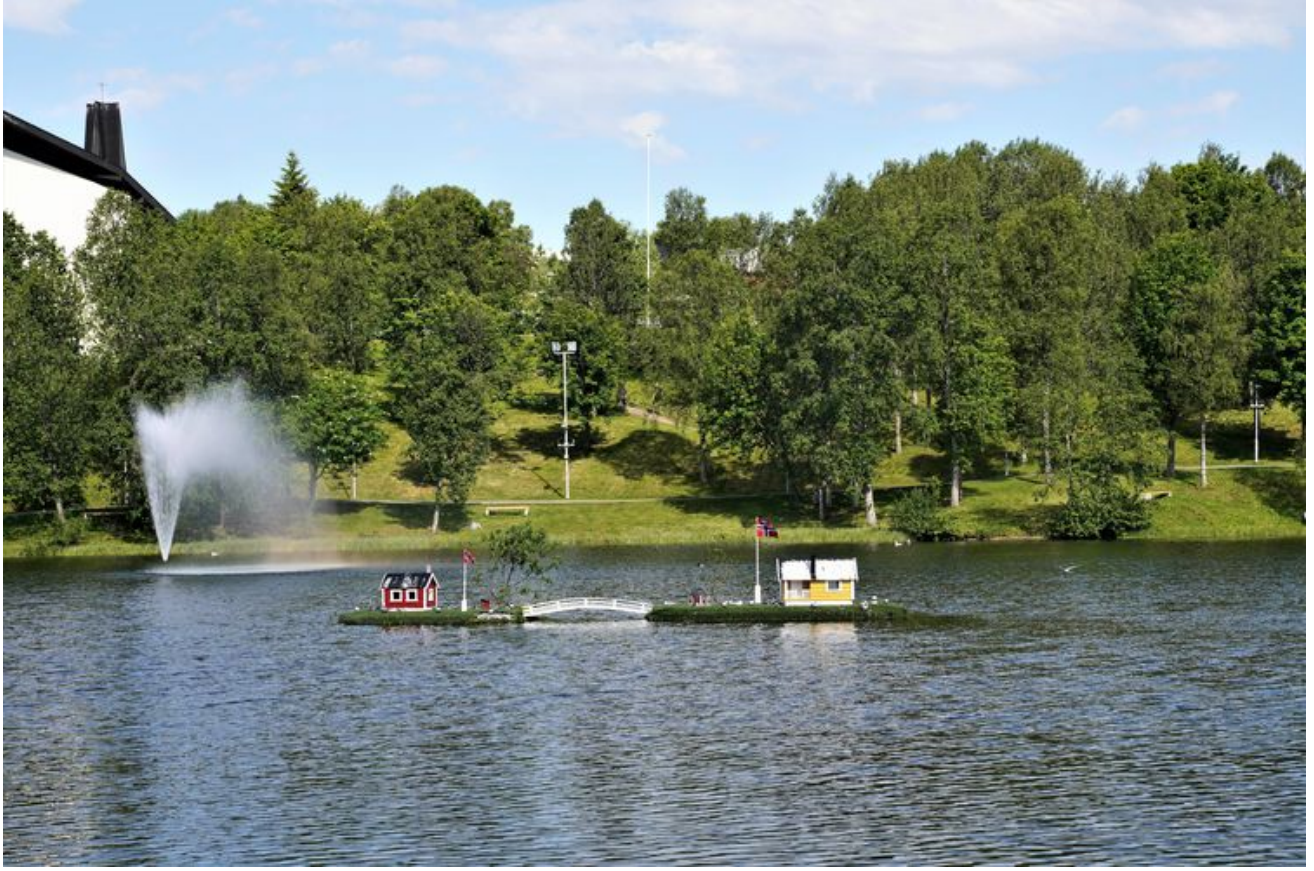
途中景观。挪威人真会精心打扮自然界。