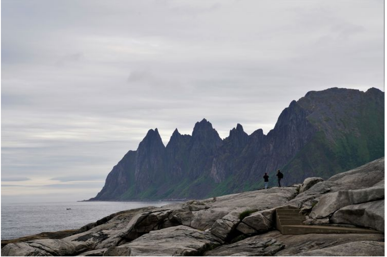
天气不好，但仍感觉到山峰的气势。