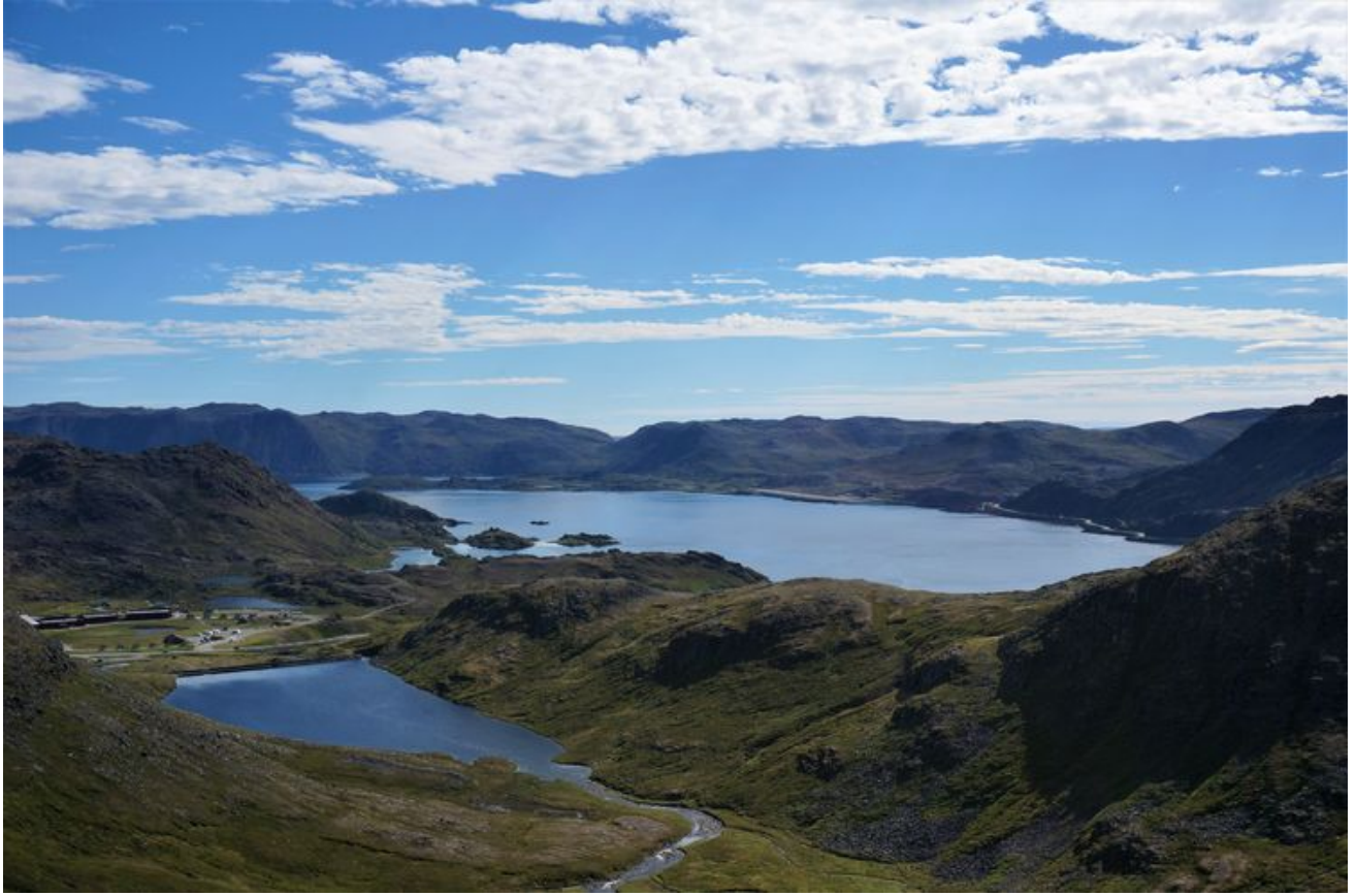
徒步前往北角途中