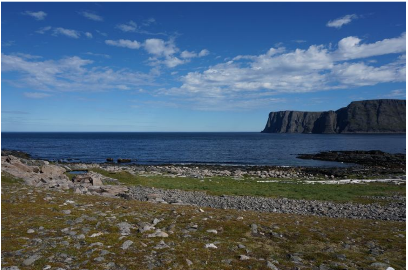
对面就是有地球仪的游客中心。