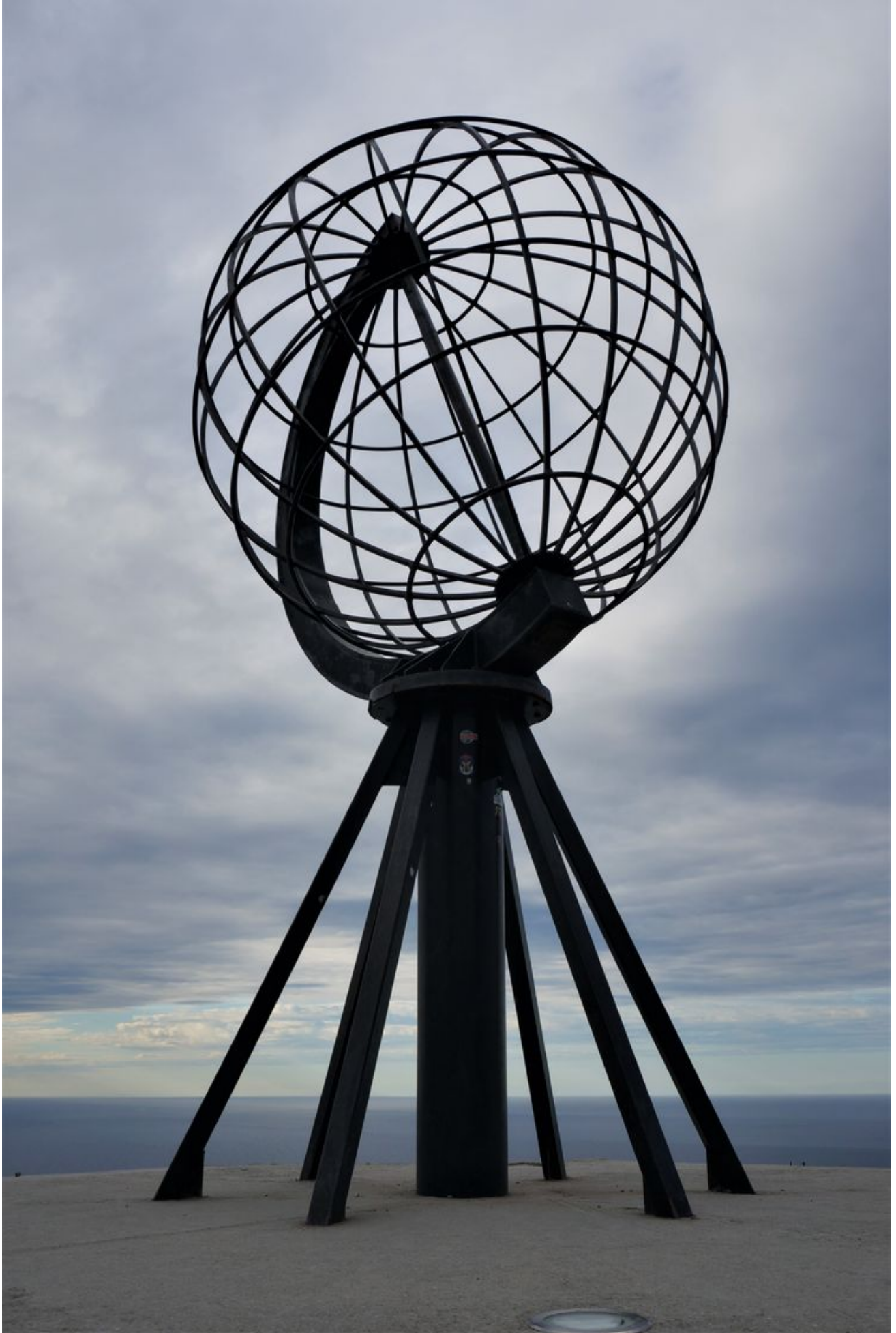
北角观景台的地球仪，北纬71.10.21。这不是真正的北角，只是一个游客中心，汽车可达，所以大批游客来这里参观，但要收费。真正的北角是北纬71.11.08，需要徒步约两个小时，但是路很好走。