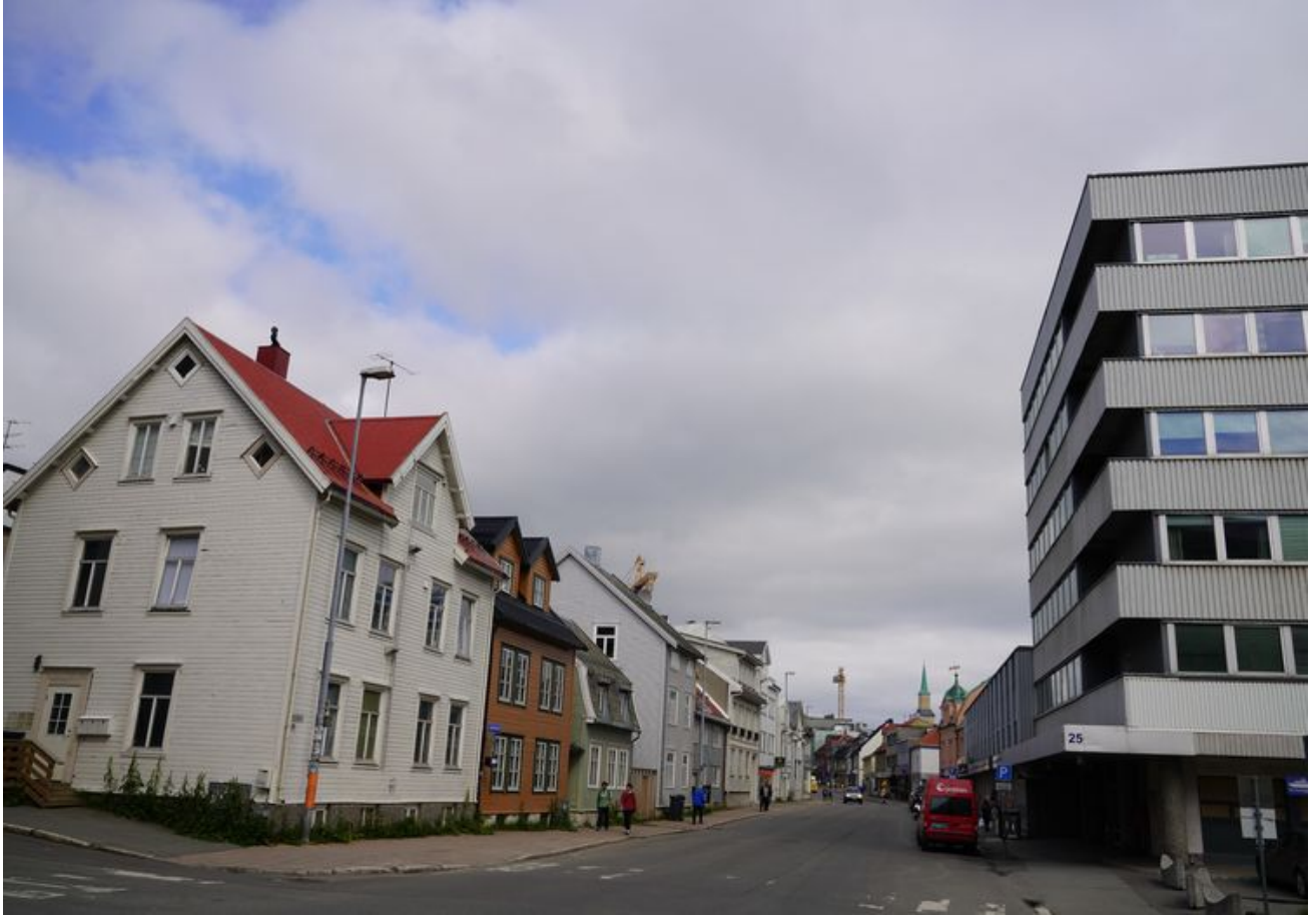
街景。实在找不出更好的照片。