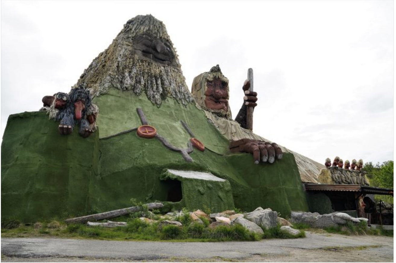
塞尼亚岛的树怪 (Troll) 公园