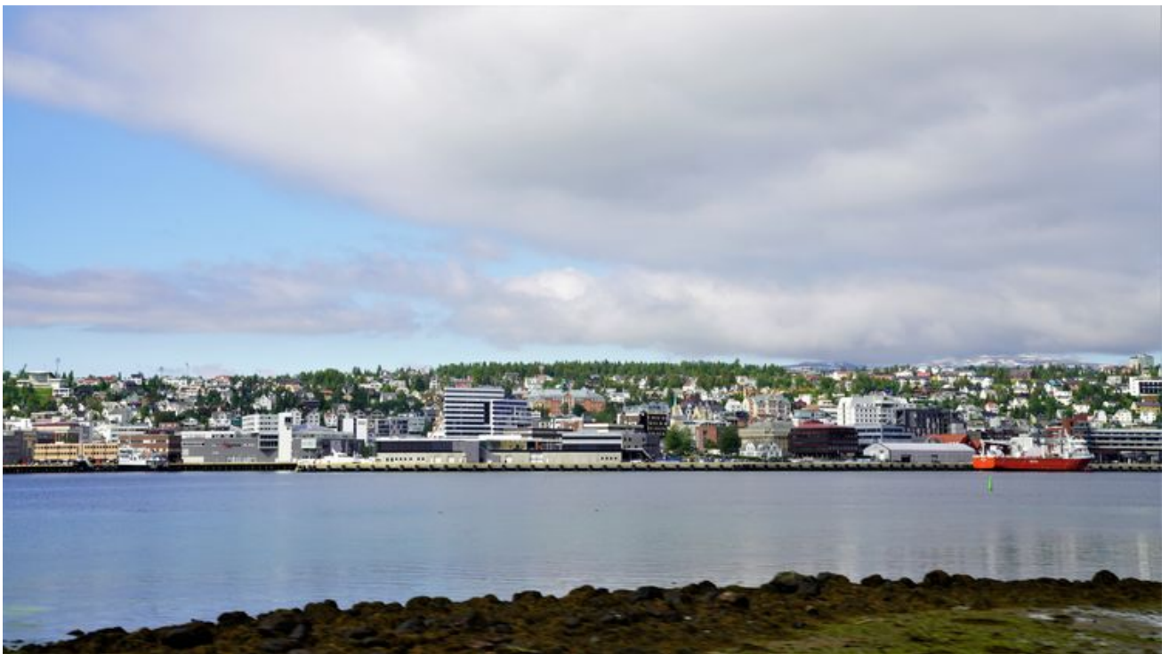
好像这个角度还可以。